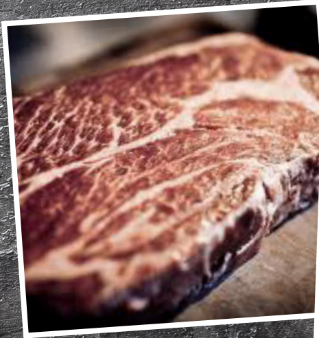
HÖGREV FET 76:-/kg