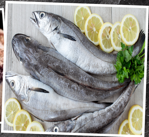
KUMMEL MSC 72:-/kg Nordostatlanten