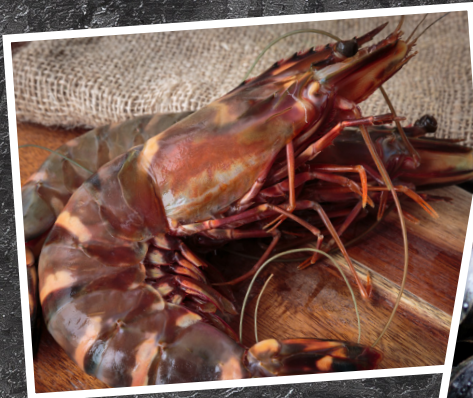
GAMBAS ARGENTINA 126:-/kg